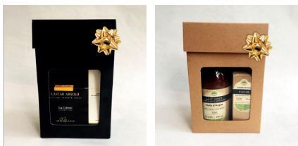
TG Coffrets Pharmavance du dépôt